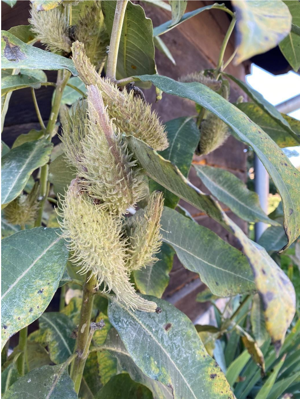
Slika 2. Plod (tobolac) ciganskog perja, foto: Vita projekt d.o.o., Strug, Lonjsko polje, 24. rujna 2021.