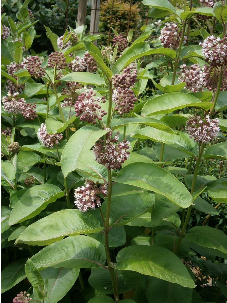
Slika 1. Cigansko perje ( Asclepias syriaca L.), foto: Meneerke bloem, CC BY-SA 3.0, Wikimedia

U ranu jesen dozrijevaju do 8 cm dugi, mjehurasti plodovi tobolci pokriveni bodljikasto - bradavičastim dlakama (Nikolić i sur., 2014). Oblikom podsjećaju na papigu pa se vrsta vrlo često može naći pod nazivom „papiga cvijet“ ili „papagajka“ (Slika 2). Mladi plodovi su zelene boje, a sazrijevanjem postaju smeđesivi. Sadrže brojne sjemenke koje su smeđe boje, plosnate i ovalne. Duge su 6 mm, široke 5 mm i na vrhu imaju svilenkaste bijele dlačice za rasprostranjivanje vjetrom.