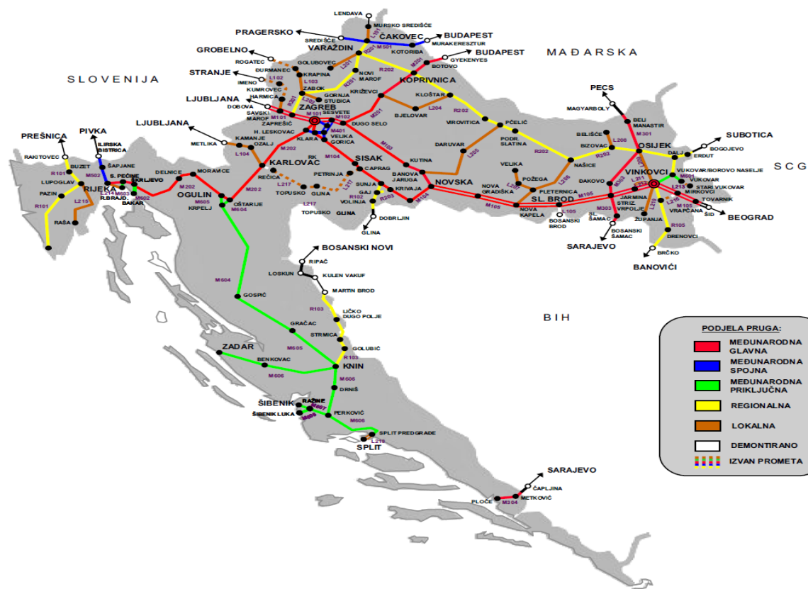
Slika 1. Mreža željeznica u Republici Hrvatskoj